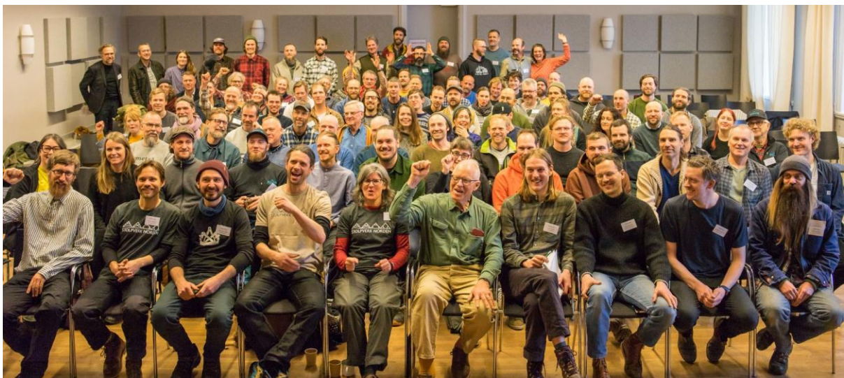
Foto från konferensen i februari 2023

Den här gången blir det inte en vanlig konferens med föredrag, utan vi erbjuder olika praktiska och teoretiska kurser som leds av hantverkare med stor erfarenhet av stolpverksbyggande. Vi har satt ihop ett urval av kurser med olika inriktning och vi hoppas att du ska hitta en kurs som passar dina förkunskaper och ditt intresse för kunskapsfördjupning. Kurserna går parallellt under fredagen och lördagen 2-3 februari och startar redan på morgonen kl 8.